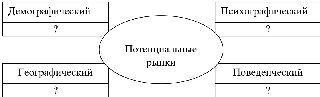
Схема сегментирования рынка УК – 10 .

Задача 23: Какой этап жизненного цикла переживают в настоящее время перечисленные ниже товары и услуги (с привязкой к месту Вашего проживания): УК – 10, ОПК – 1 .